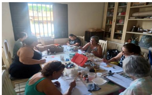
Atividade realizada: Projeto Nossas Mulheres