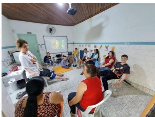
Atividade realizada: Roda de Conversa Data: 14/11/2024