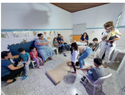
Atividade realizada: Roda de Conversa Data: 21/11/2024