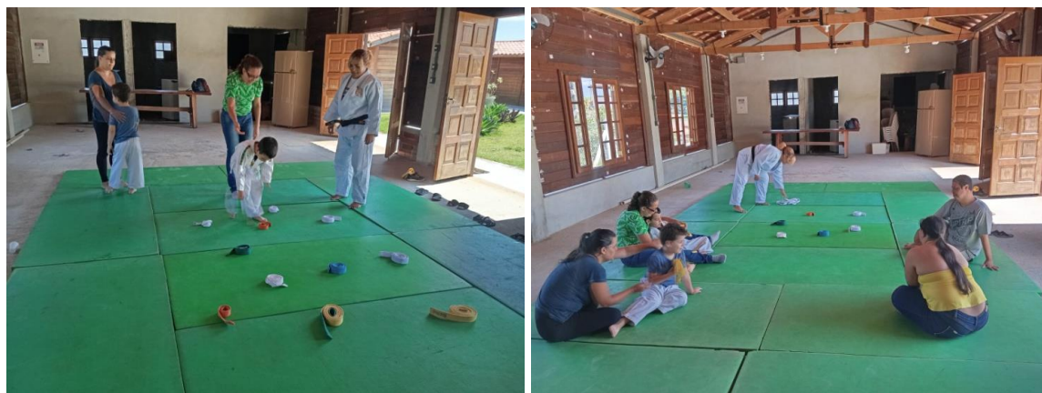
Atividade Extra: Judô Inclusivo Data: 25/11/2024