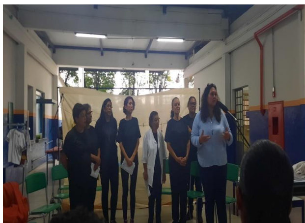
Atividade Extra: Oficina de Teatro e Musicalização Mães