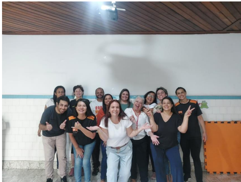
Atividade realizada: Encontro de Equipe Data: 05/11/2024

Sede atual: Rua Alexandre Fleming 72, Jardim Ícaro - Guaratinguetá – SP - CEP 12.506-131