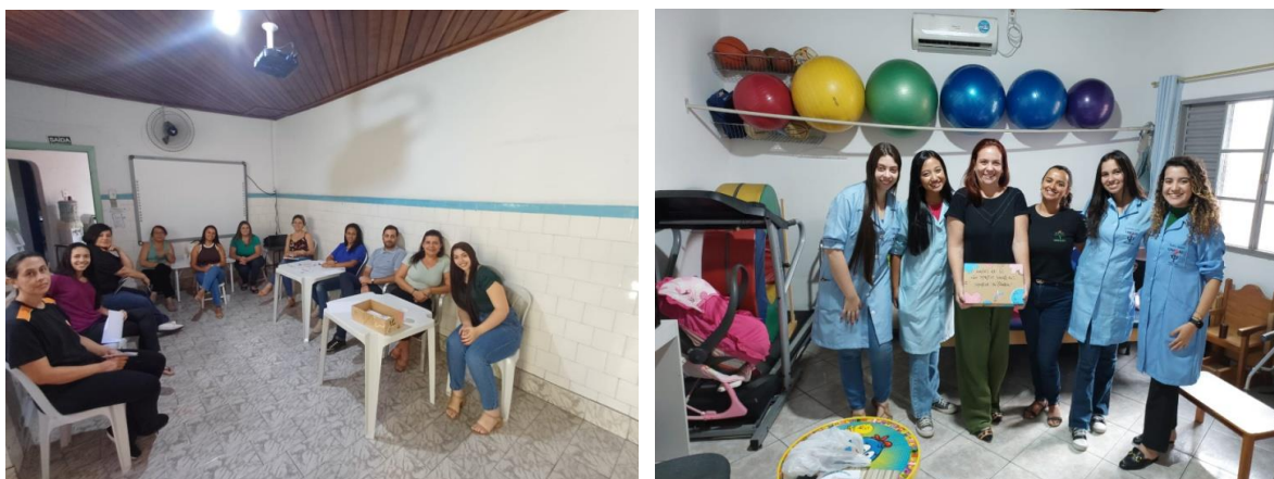
Atividade Extra: Cuidar de quem Cuida Data: 26/11/2024