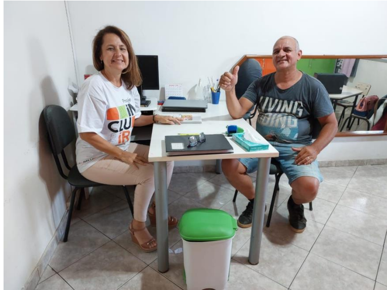
Atividade Realizada: Orientação com a Psicóloga Data: 28/11/2024