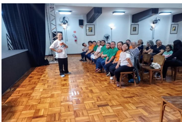
Atividade Extra: Teatro e Musicalização Jovens