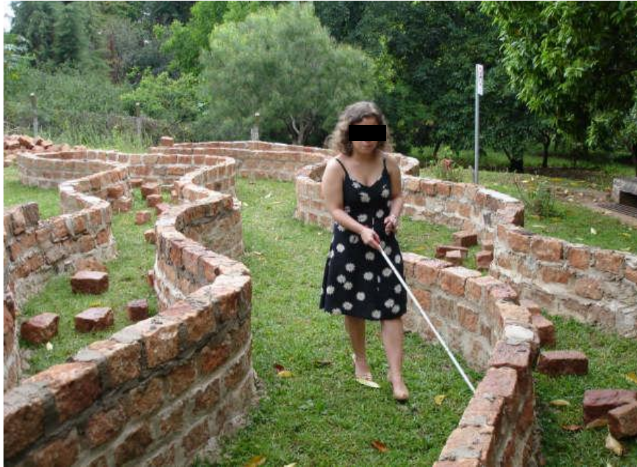
Figura 3. Teste da distância entre canteiros e piso de grama.