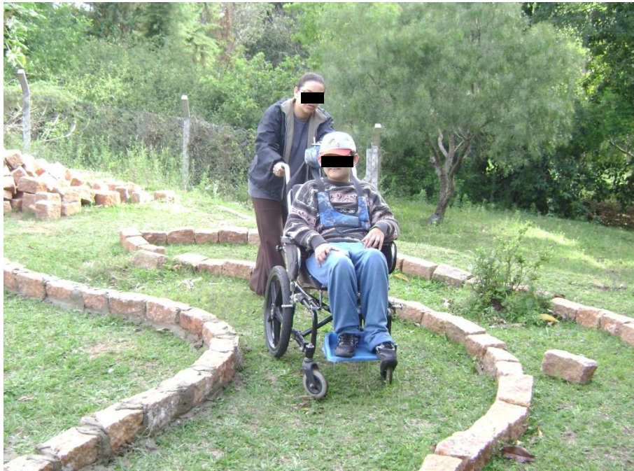
Figura 2. Início da construção, teste da passarela para cadeirante.