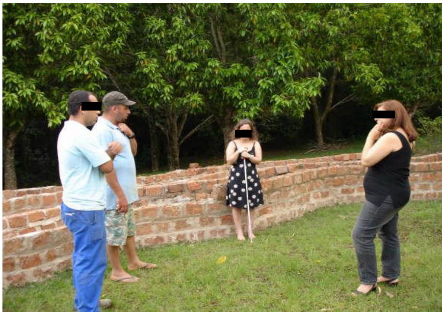
Figura 5. Discussão sobre as disposições das plantas no canteiro.